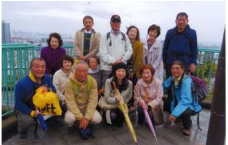
ビーナスブリッジ