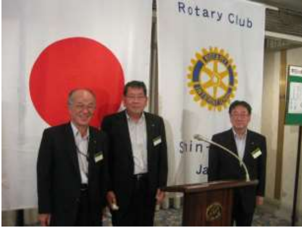
久富会長と9月が誕生月の村角会員、谷口会員