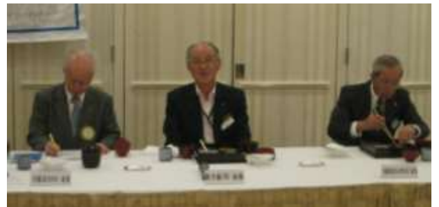
合同例会の詳細な様子は次週掲載させていただきます。