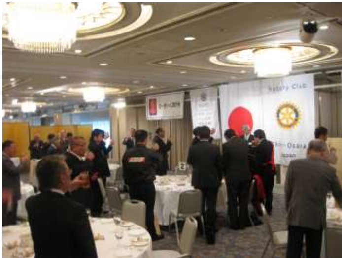
第1400回記念(1月28日)の乾杯の様子