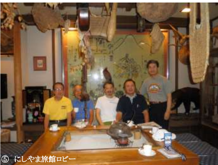
⑤ にしやま旅館ロビー