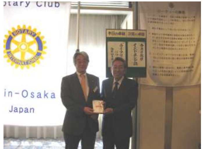
恒例のライフリバーへの寄附金贈呈が行われました。

どうかこれからも、ライフ・リバーとともに、開発途上国の貧しく小さくされている人々と共に歩んでくださいますようお願い申し上げます。本当にありがとうございます。