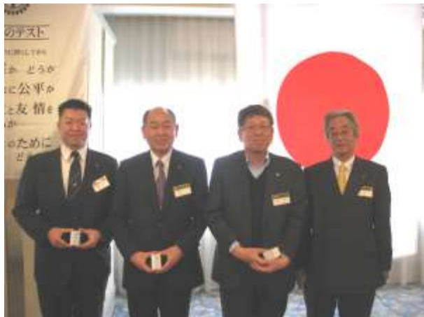
横山会長と4月が誕生月の村木会員、北野幹事、山路会員

先週、大阪でも桜の開花宣言が出て、もうすでに桜の名所スポットは満開を迎えようとしています。全国に桜の花見スポットは数あれど、大阪城・姫路城・熊本城などの、城址公園がとても多いことにお気づきの方も多いのではないのでしょうか。