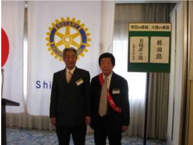
大橋会員 マルチプルPHF+1 認証おめでとうございます！