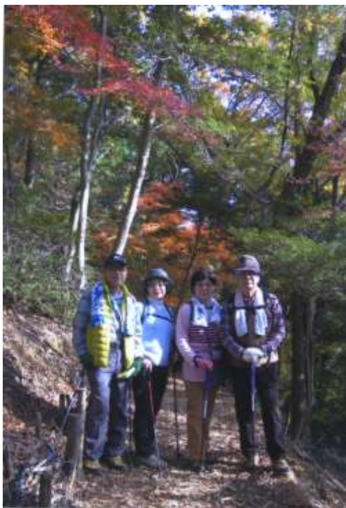
9時に阪急 箕面駅に5人が集合し、車で「教学の森」入口

展望台から山を下り、瀧安寺弁天堂から滝道に入りました。そこから滝まではまるで初詣の様な人ごみでした。