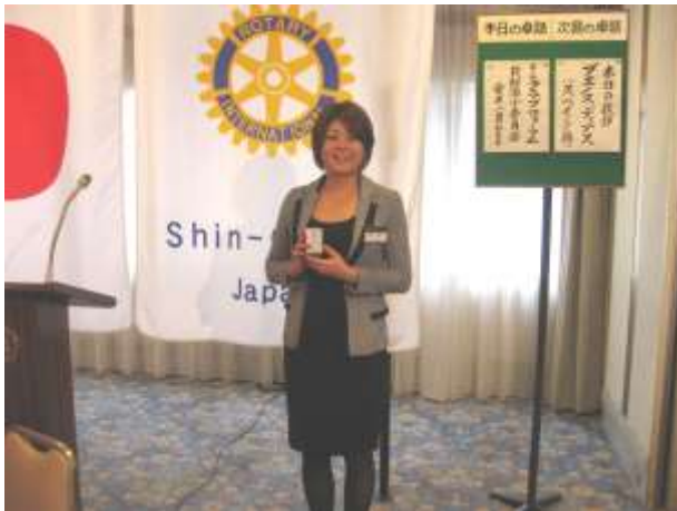
11月が誕生月の武市会員