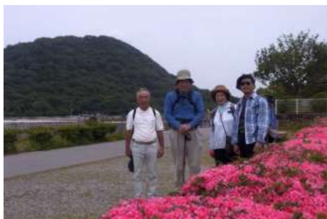
北山貯水池にて。後方は甲山