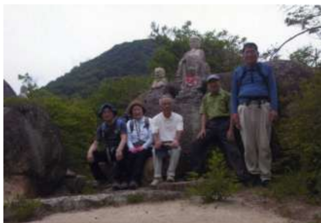
西国八十八か所 石仏