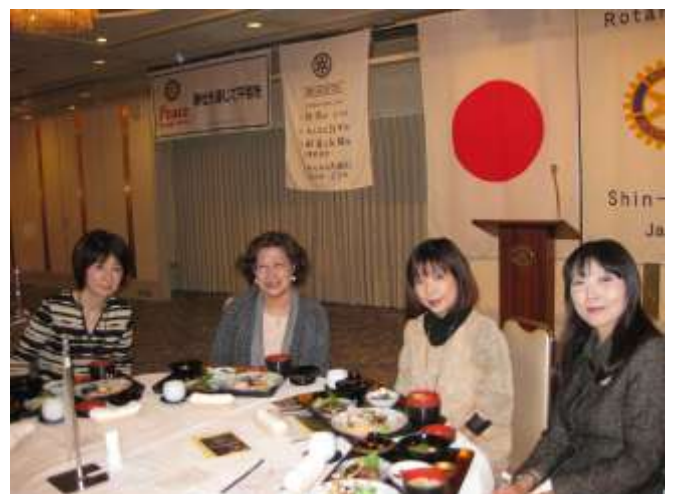
会員ご令室の皆様