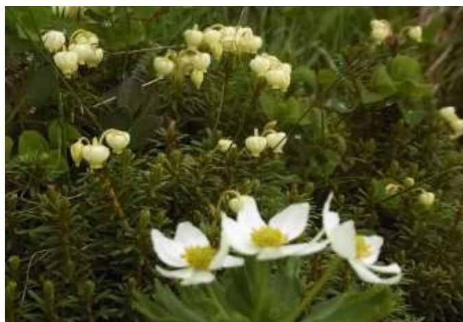
アオノツガザクラ(奥) チングルマ(手前)

12時に剣御前小屋(2750m)に到着。お昼のおにぎりを食べて、雨が止むのを1時間くらい待ちましたが、天候も回復せず、霧も出てきたので別山への登山をあきらめ、登ってきた道を引き返しました。15時40分雷鳥荘に着き、早速雨で濡れた雨具、手袋、リュック、靴を乾燥室で干しました。温泉で冷えた身体をゆっくり温めると、生気を取り戻しました。明日天気良ければ最後のアタックに望みをかけて19時30分に就寝。