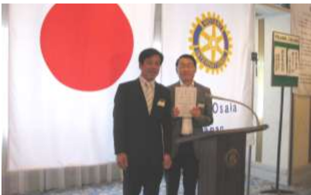
安井会員は地区国際奉仕委員を務められることになりました