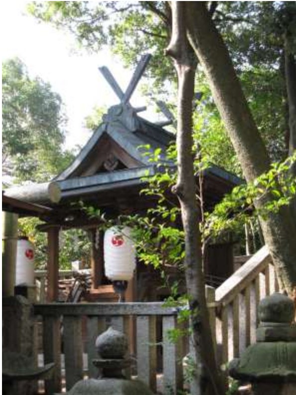
《前方後円墳の前方部分上に建つ本殿は春日造。》