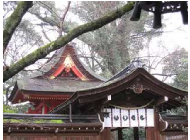
《上: 拝殿 下: 本殿》