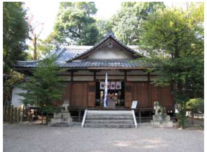
《切妻造瓦葺の割拝殿》

当社より7.5kmほど北方に「矢田坐久志玉比古命神社」(週報1224号 奈良市内・大和郡山編⑩掲載)や、明日香村に「櫛玉命神社」(週報1172号 明日香編③掲載)があり、これらの男神に対する姫神を祀る神社としての鎮座も考えられるが根拠はない。