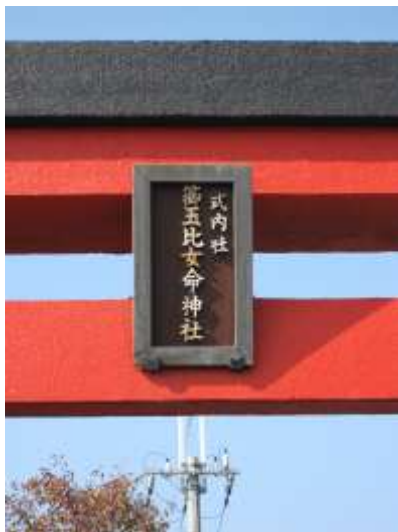
《赤鳥居の額の拡大》