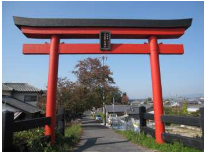
《南北に流れる葛城川に面した赤鳥居が青空に映える。》

奈良県北葛城郡広陵町弁財天に鎮座する。高田川と葛城川に挟まれた地域で、境内地全体が前方後円墳になっている。その後円部に本殿が設けられていて、古墳信仰に基づく古代祭祀遺跡として注目されている。