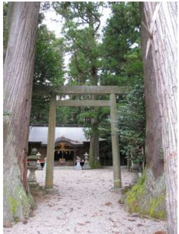
《御杖神社 境内入口》

宇陀郡御杖村神末(こうずえ)に鎮座する御杖神社は、元伊勢伝承地「佐佐波多宮(うたのささはたのみや、菟田笹幡・佐々波多宮とも書く)」の候補地の一つである。