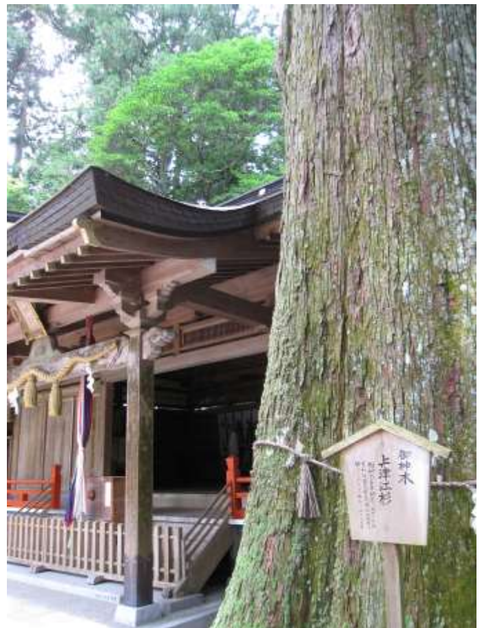
《樹齢600年のご神木「上津江杉」と拝殿。》

当社の祭神三座は、古来、鬼・疫病神が都や神域に入るのを防ぎ止めて宮中・神宮を守護するため境界四方で行われていた道饗祭(みちあえのみまつり)の神々で、当地は伊勢神宮との関係が深く、また、国境の地であることから往昔には道饗祭が行われていました。』