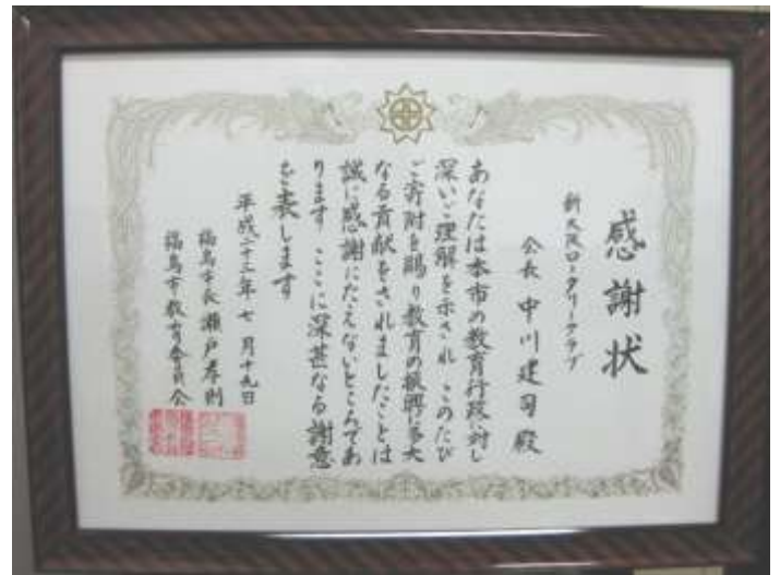
福島市長・福島市教育委員会より感謝状を戴きました。