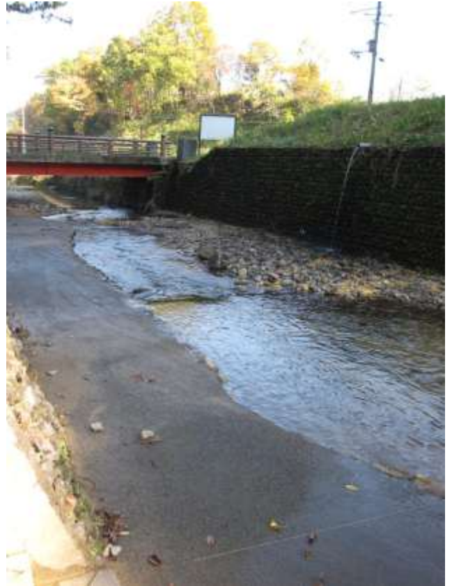
《当社南側を流れる本郷川》

本殿の建て方は、伊勢神宮と同じ神明造で南向きである。神社南側には当社の御手洗川「本郷川」が流れ、その清流に心癒される。