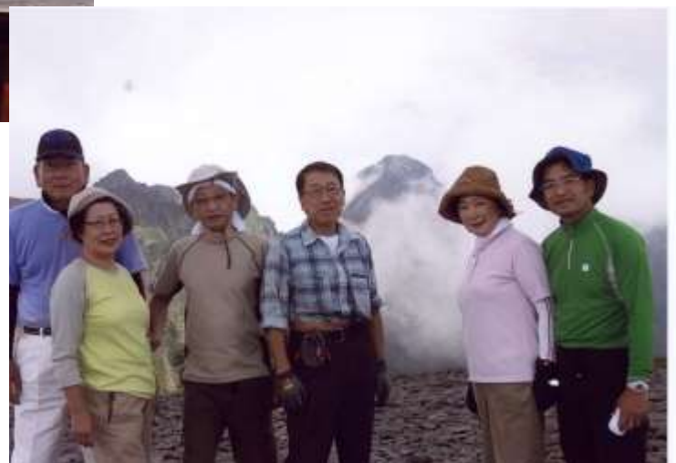
八ヶ岳の最高峰 赤岳(2899m)