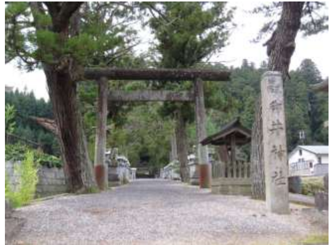
《369号線からよくみえる鳥居》

鎮座地は、宇陀市榛原区檜牧字高取、近鉄大阪線榛原駅より369号線を南東へ車で5分ほど走ったところ。道路沿いで見つけやすい。食井明神や気比明神と称されていたこともあった。祭神のうち御井神について、古事記は「大己貴神と稲田八上姫の子の木俣の神、亦の名を御井神」と記している。延喜式神名帳頭注には「御井素盞鳴尊の子也、母稲葉八上姫」と記されている。