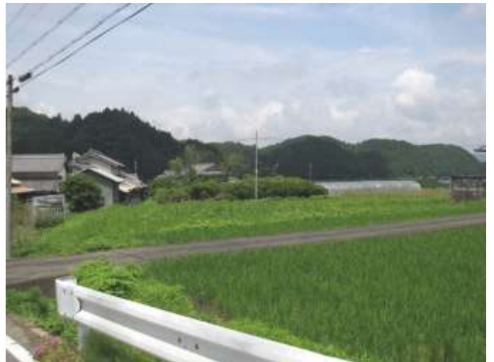
《菟田野区平井の景色に安らぐひと時。》

創祀等明らかではないが「天養元甲子年八月、安の井 と称するところに現れ出でた日光の如く光の輝く先が、三 方に亘っていた。その先をみると一つは大井戸に、一つは