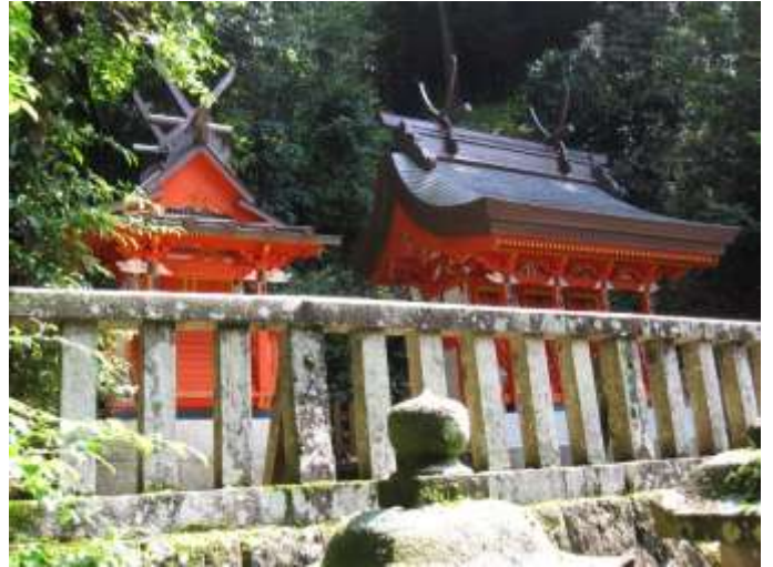
《向かって左側が御井神社の社殿。》

現在宇陀市菟田野区平井にある「皇太神社」の境内社 として、本殿の向かって左に朱塗の春日造の社殿があり、 ここに「石神神社」と共に「御井神社」が合祀されている。 近鉄大阪線榛原駅より南方に約4.5kmの地点、伊那佐 山の南側に位置する。小さな集落のはずれの細い道を奥 へ入って行った突き当りにある。この御井神社の旧社地は、 宇陀市菟田野区平井字安井の高台にあり、石積の社壇や 「三井明神」の社標石などが面影をとどめているというが、 字安井は地図に記載がなく、特定できなかった。