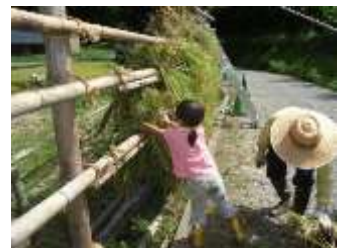
天日乾燥(ハサかけ)