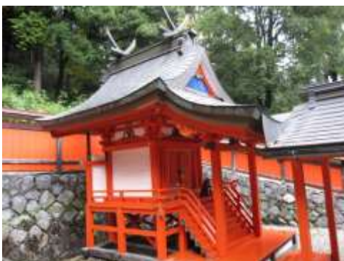
《上:菟田川之朝原伝承地の石碑 下:春日造の本殿》