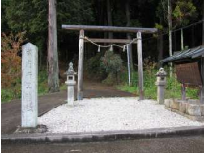
《入口までは車で登ってこれる。》

宇陀市榛原区雨師字朝原に鎮座する。近鉄大阪線榛原駅より西方約3km、雨師集落の中、細い急な坂道を上がった突き当たりが神社。