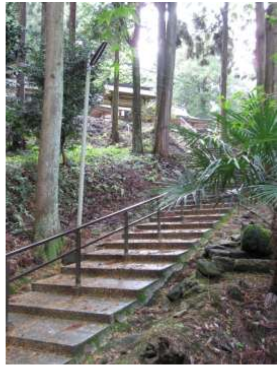
《カーブを描く参道の階段はとても雰囲気が良い。》