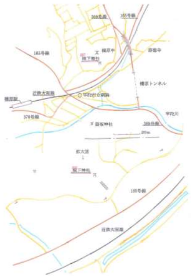
※丹生神社の地図は次回掲載します。