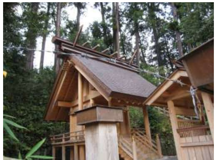
《上:急な山の斜面に鎮座する神社。下:神明造の本殿》