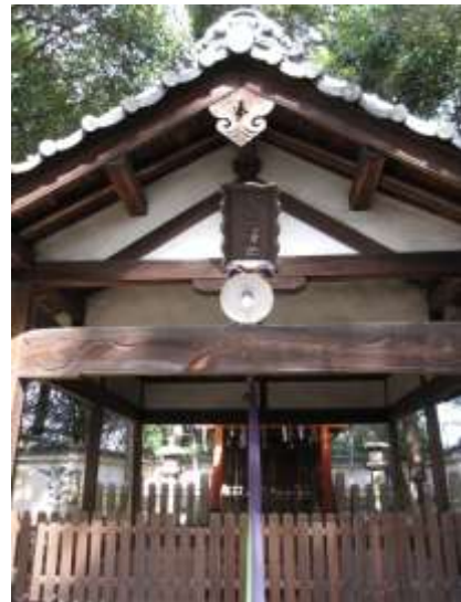
《A社 上：入口 下：拝殿と本殿》