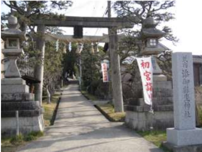
《B社入口 車で鳥居をくぐり通り奥へ進むと駐車場がある。》