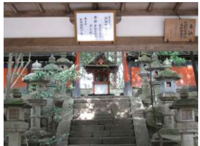
《A社 上:入口 下:本殿》