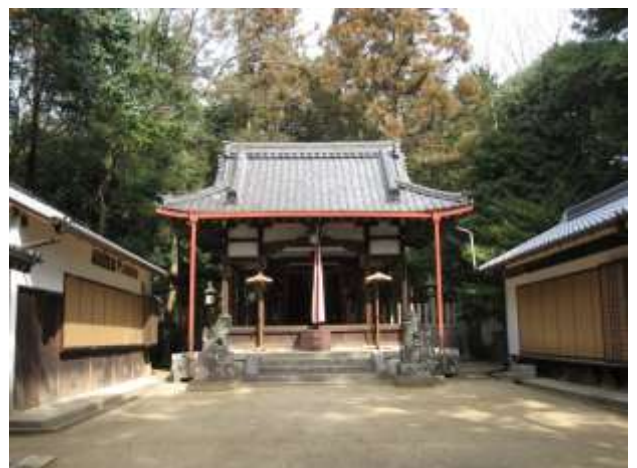
《B社 上：入口 下：拝殿》